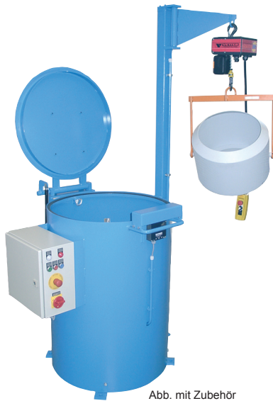
Abb. mit Zubehör