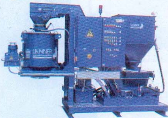
Système automatique de broyage & essorage copeaux, (compacte, sur plateforme) de type « VETAMAT ».